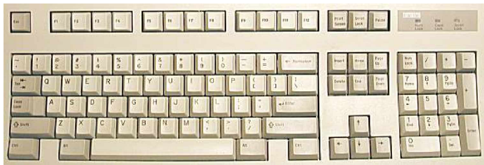
Gambar 6. 101-Key AT Keyboard