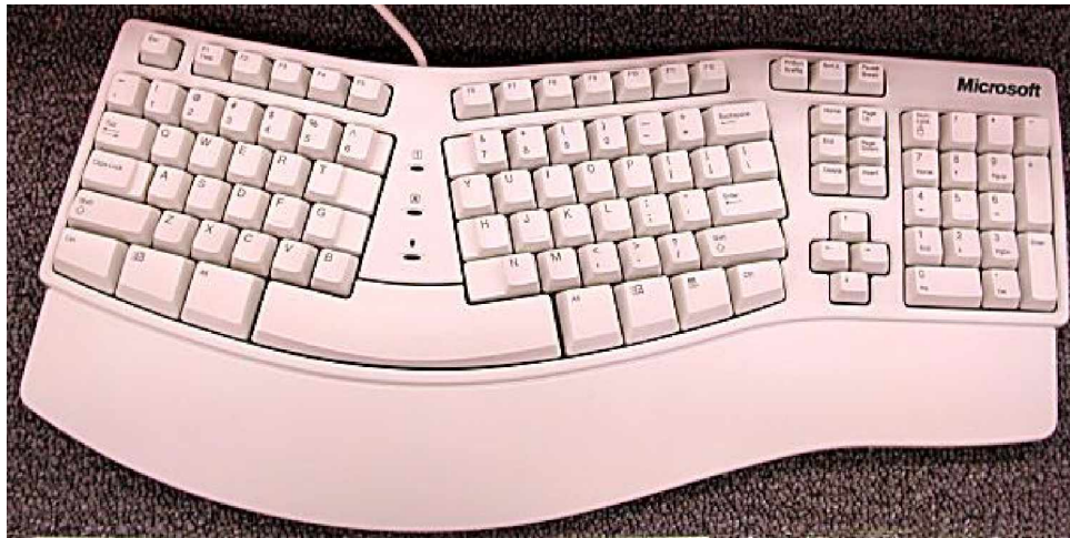
Gambar 8. Keyboard Ergonomic