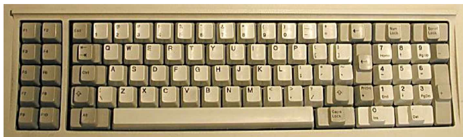
Gambar 4. 83-Key PC Keyboard