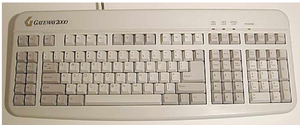
Gambar 9. Programmable Keyboard

Kunci-kunci pada keyboard dapat terganggu atau tidak berfungsi karena :