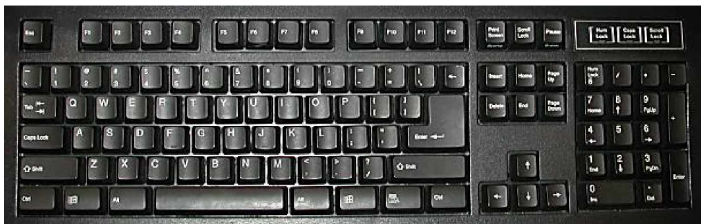
Gambar 7. 104-Key Standard Keyboard