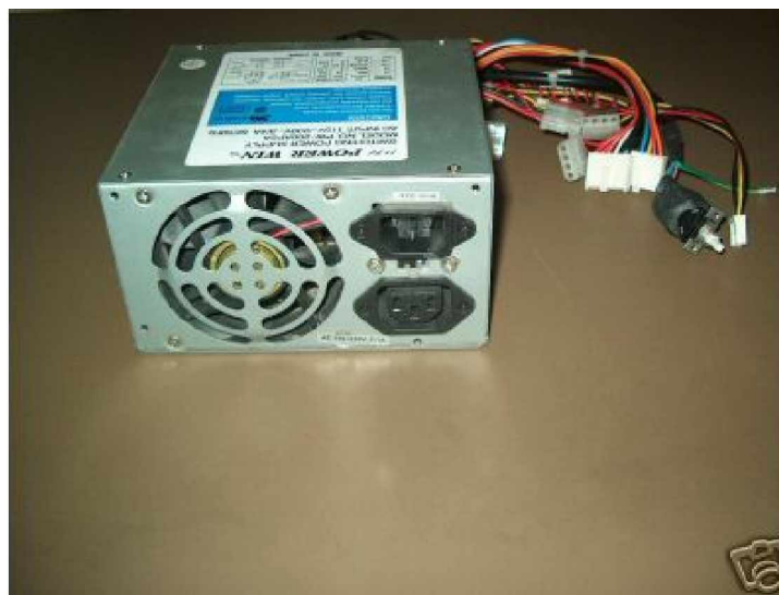
Gambar 1. Power Supply Jenis TX

Jika saklar power dihidupkan, maka kipas akan berputar, tegangan pada soket P8 dan P9 bila diukur dengan memakai voltmeter adalah seperti pada table 3.1. Khusus untuk signal power good jika diukur dengan voltmeter akan bertegangan +5V sesaat kemudian turun menjadi mendekati 0V ketika saklar power dihidupkan.