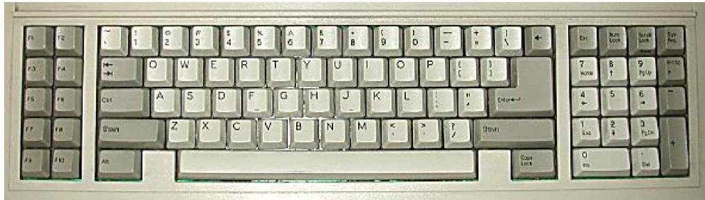
Gambar 5. 84-Key AT Keyboard