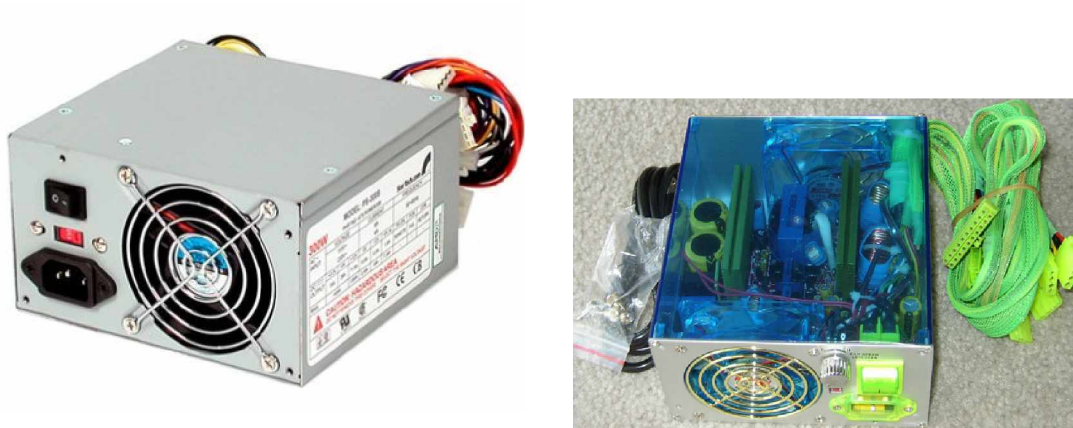
Gambar 2. Power Supply Jenis ATX

Note : Pn, Psn dan Jn adalah label konektor pada system board. Pin 1 adalah pin paling samping pada unit system.